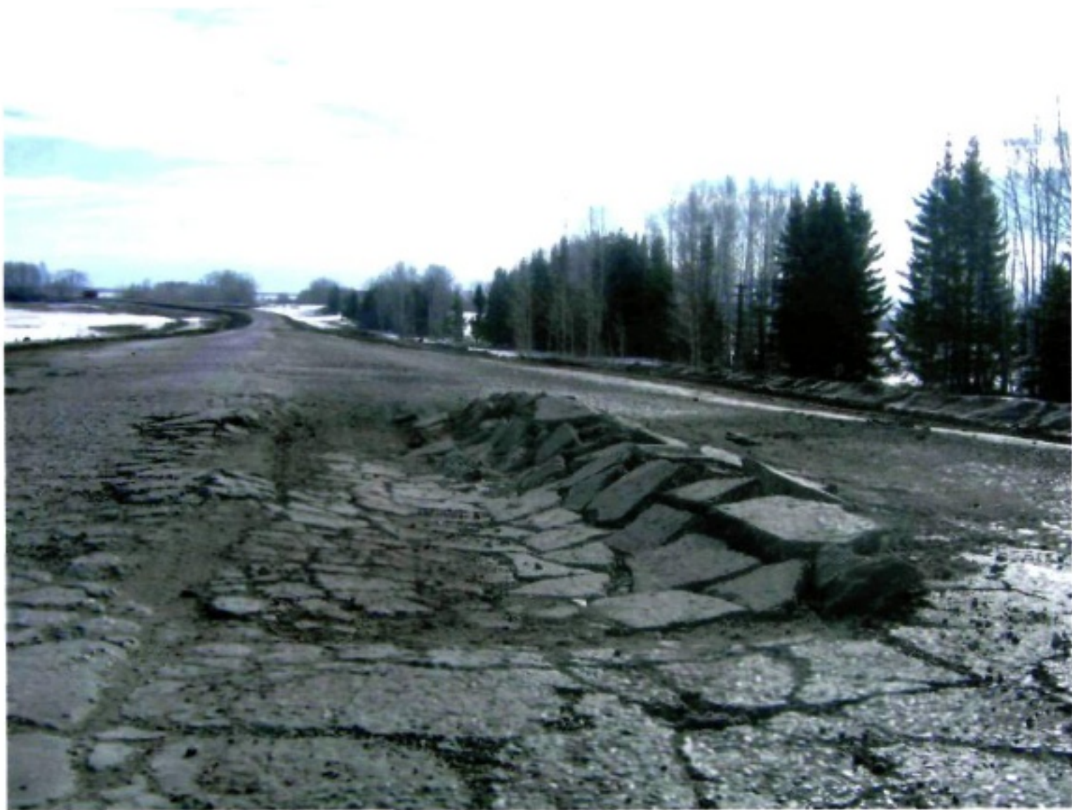
Харків-Куп'янськ-Мілове (Р-07 відрізок дороги Чугуїв-Куп'янськ)