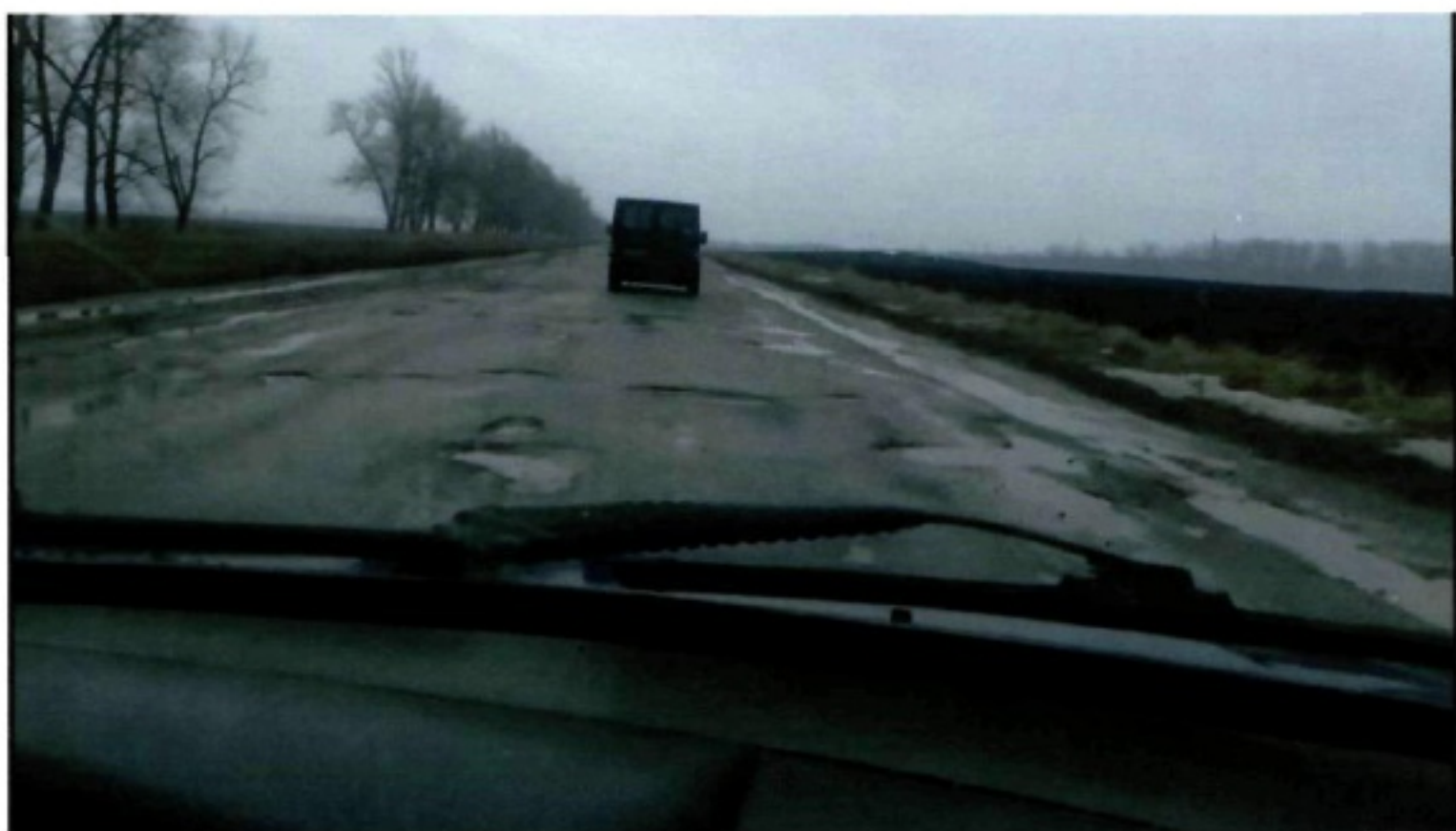
Харків-Куп'янськ-Мілове (Р-07 відрізок дороги Чугуїв-Куп'янськ)