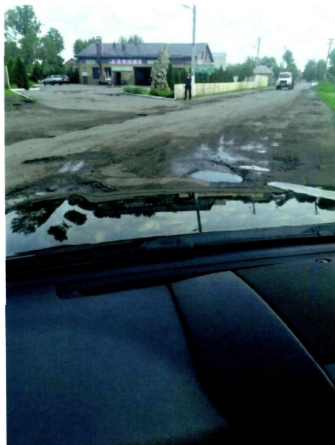
Дергачі-Козача Лопань (Т2117)