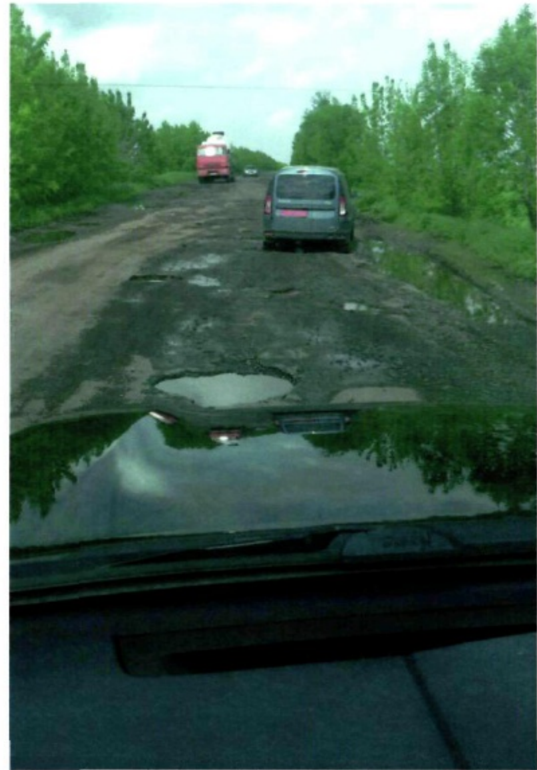
Дергачі-Козача Лопань (Т2117)