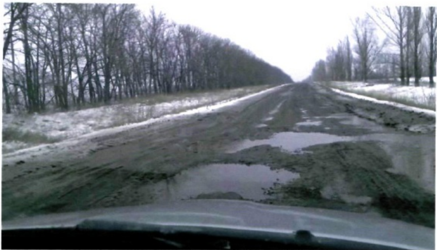
Харків-Куп'янськ-Мілове (Р-07 відрізок дороги Чугуїв-Куп'янськ)