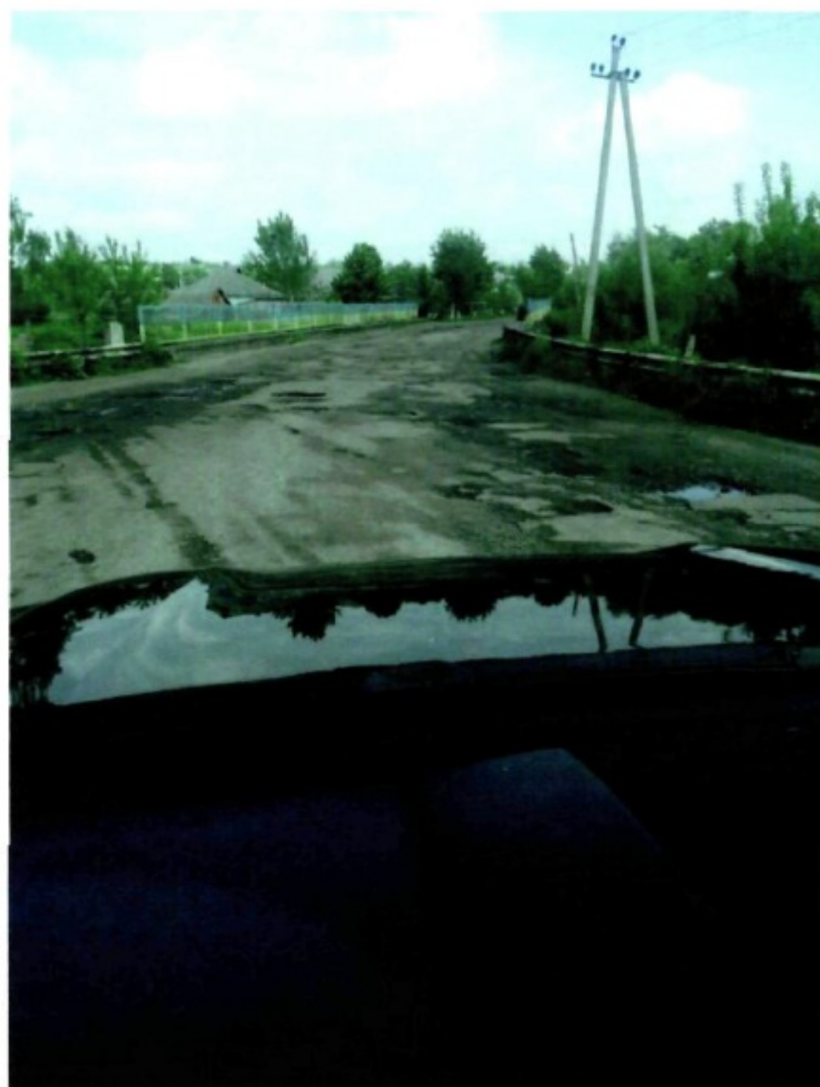
Дергачі-Козача Лопань (Т2117)