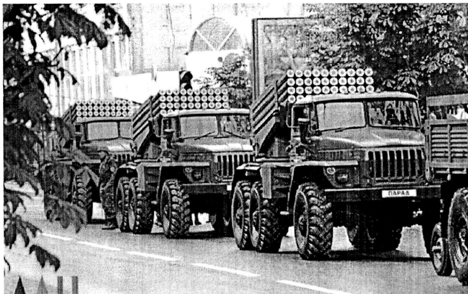
Парад Победы в Донецке 2016

В параде в Донецке задействованы почти 45 единиц техники, в Луганске - 70. В Донецке и Луганске 9 мая начались военные парады в честь Дня Победы.